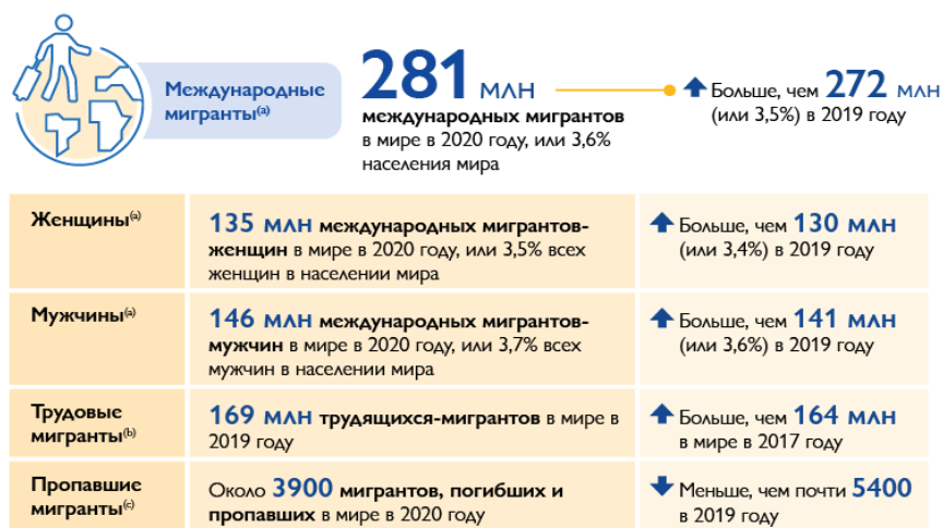
Рис.1. Основные данные о миграции на период 2019-2020гг. Источник: Доклад о миграции в мире 2022 6

Привлечение иностранных работников по приоритетным специальностям в соответствии с потребностями государства, является необходимостью для экономического развития. Одним из источников увеличения численности стран, то есть необходимыми предпосылками прогресса, является переселение мигрантов на постоянное место жительства Рис.2. Однако проблемы миграции населения являются также политическими, поскольку они связаны с пересечением национальных границ значительным количеством людей, а также с формированием на территории страны иммиграции нередко больших по размерам общин с неустойчивым миграционным поведением, что способствует повышению социальной напряженности [3].