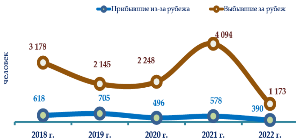
Рис.3. Внешняя миграция (Прибытие и выбытие населения на постоянное проживание).

В январе-марте 2022 года общее количество прибывших составило 52 825 человек, в том числе 52 435 из них прибыли из других регионов республики, выходцы из-за рубежа составили 390 человек. Общая численность выбывших составила 53 608 человек, в том числе 52 435 из них выбыли в другие регионы, 1 173 человека выбыли в зарубежные страны, сальдо миграции составило минус 783 человека [7].