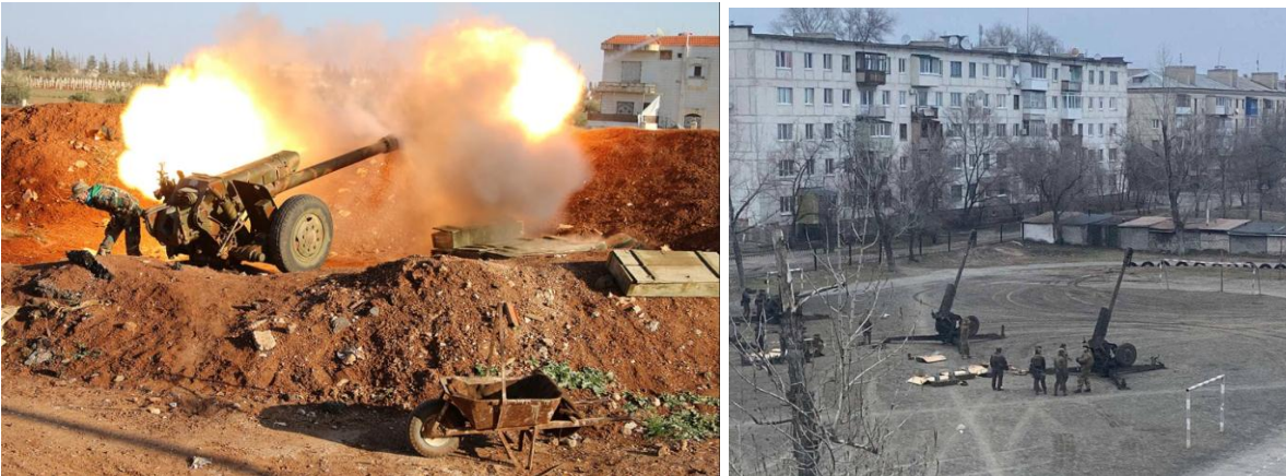
2-расм. Артиллерияни шаҳарда қўлланилиши

ўртасида жуда кўпол алоқа чизиғини яратади, бу уларнинг бўлинмаларини "дўстона олов" билан уриш хавфини оширади. Натижада, ёпиқ позициялардан отиш фақат душманнинг чуқур орқа қисмидаги нарсаларни уриш учун ишлатилади. Шунга қарамай, хужум гуруҳлари билан ҳамкорликда ва уларнинг манфаатлари учун тўғридан-тўғри ўқ отишга қодир ўзиюлар қуроллар алоҳида аҳамиятга эга. Шу билан бирга, ажратилган артиллерия бошқаруви марказлаштирилмайди ва унинг сони ҳал қилинаётган аниқ вазифа ҳажмига боғлиқ. Бундай шароитда олов тизимини қуриш, шуни таъкидлаш керакки, тўғридан-тўғри олов остида душман илғор артиллерия бўлинмаларини қанотлардан четлаб ўтишга интилади; бундай маневрларни бостириш учун жавобгарлик хужум гуруҳига ёки химоя гуруҳларига юкланган. Шунини ҳам унутмаслигимиз керакки, шаҳар биноларида кучли артиллерия зарбалари жуда кўп миқдордаги чангни кўтаради, бу эса кўриб чиқиш ва ўзаро таъсир қилишни қийинлаштиради (2-расм). Миномёт батареялари, қоида тариқасида, баррикадалар, бинолар ва ҳовлилар орқасида яширинган душман ишчи кучини йўқ қилиш учун марказлаштирилган фойдаланишни топади. Минамёт бўлинмаларини томларга жойлаштириш самарали отиш оралиғини сезиларли даражада оширади.