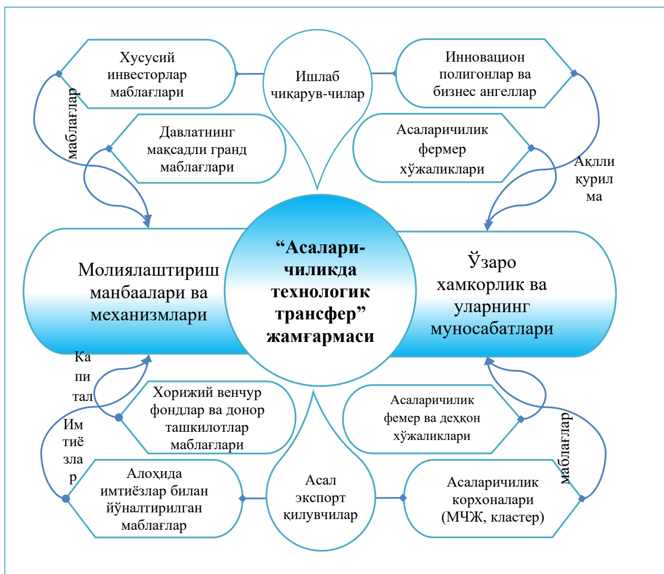
1-расм. “Асаларичиликда технологик трансфер” жамғармасининг такшилий-иқтисодий муносабатлари 2

Ушбу жамғарманинг мақсади асаларичилик хўжаликларида замонавий рақамли технологияларни жорий этишни молиявий қўллаб-қувватлаш, уларни имтиёзли кредитлар, янги технологияларнинг амалиётга жорий этилишига қўмаклашиш, хўжаликларнинг қизиқиш ва кўникмаларини ошириб бориш ҳисобланади.