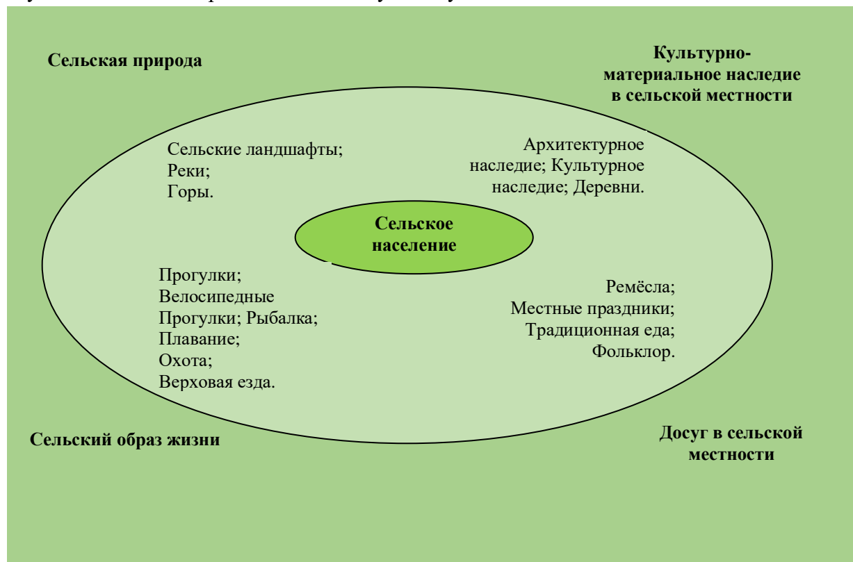
Рис.-1. Концептуальная модель сельского туризма

При этом важно понимать, что эффективное развитие сельского туризма возможно лишь в случае «баланса интересов» всех вышеупомянутых компонентов.