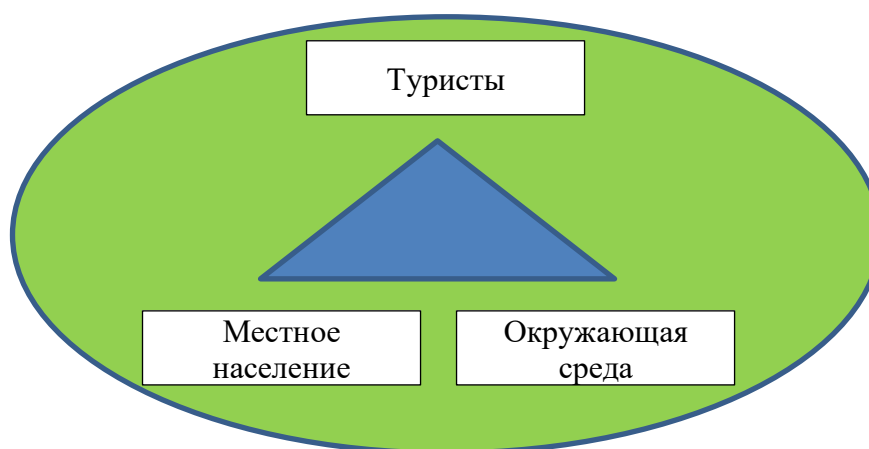
Рис.-2. Равновесие, необходимое для процветания сельского туризма

Для того чтобы обеспечить гармоничное сосуществование всех элементов сельского туризма, нужно учитывать интересы местного населения, туристов и заботиться об окружающей среде. Это так называемая «триада процветания сельского туризма» (рис.-2).