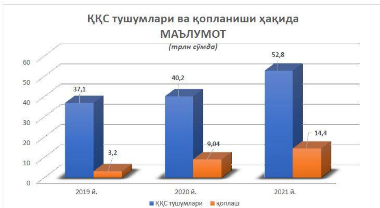
2-диаграмма. Қўшилган қиймат солиғи тушумлари ва қопланиши бўйича маълумот

2021 йилда солиқ ва божхона органлари томонидан маъмурлаштириладиган қўшилган қиймат солиғи бўйича тушумлар 52,8 трлн. сўмни ташкил этди (қоплаш суммаларини ҳисобга олмаганда) ёки 2020 йил билан солиштирганда 12,6 трлн. сўмга ошди. (2-диаграмма)