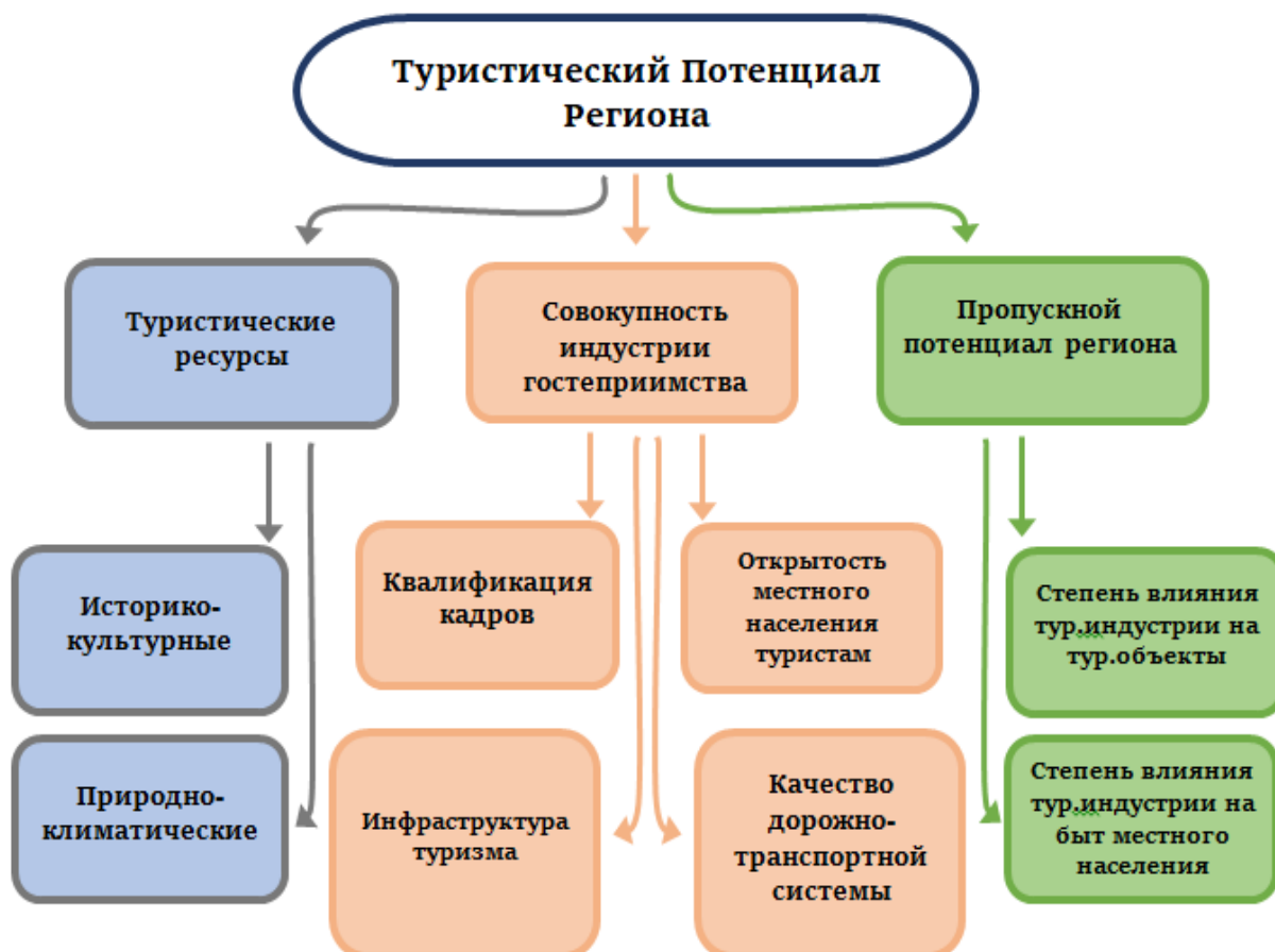
Рисунок 2. Структура туристского потенциала территории 7

потенциал» таких ученых, как Е.А.Джанджугазова. М.Сазыкин, Т.В.Николаенко, С.А.Шабалиной и В.А.Рубцова. Автором были дополнены и усовершенствованы существующие определения и формулировки «туристического потенциала региона» вышеуказанных авторов. Туристический потенциал региона – это совокупность туристических ресурсов региона, которые включают в себя как историко-культурный, так и природно-климатический потенциал, а также совокупность индустрии гостеприимства, где автор подразумевает всю инфраструктуру туризма и сферу услуг, совокупность - пропускного потенциала, который в свою очередь показывает какой поток туристов может принять данный регион без ущерба посещаемым объектам и социальной жизни населения. Наглядно авторское определение «туристический потенциал региона» представлен на рисунке 2, разработанный автором исследования.