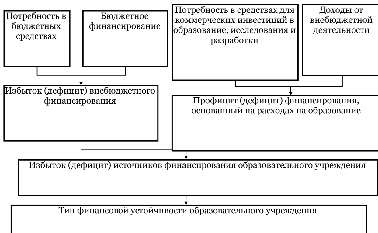
рисунок 2. Модель оценки финансовой устойчивости государственных высших учебных заведений, действующих на основе финансовой независимости

Таким образом, важным направлением совершенствования финансового механизма функционирования системы высшего образования в современных условиях является повышение финансовой самостоятельности образовательных учреждений, которая характеризуется независимостью от бюджетного финансирования и их самостоятельностью в реализации образовательной политики, научных исследованиях и другой деятельности. Поэтому для оценки функционирования финансового механизма, как следствие, было предложено рассмотреть уровень образовательной независимости образовательного учреждения за определенный период времени (рисунок 2).