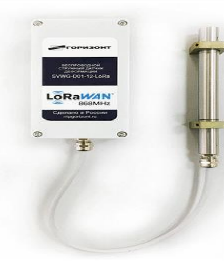
1-rasm. Raqamli inklinometr.

Nishab o'lchagich (nishab o'lchagich, egilish burchagi sensori, rulon o'lchagich) o'lchash moslamasi bo'lib, uning yordamida siz tuzilmalar va mahalliy obyektlarning fazoviy holatining barqarorligini, ularning ideal vertikalidan og'ishini aniqlashingiz va bu og'ish burchagini taxmin qilishingiz mumkin. Inklinometrlar quduqlarni burg'ilashda ularning fazoviy holatini nazorat qilish uchun ishlatiladi. Strukturaviy deformatsiya darajasi tanqidiy qabul qilinadigan standartlardan oshib ketadi. ASDM ni joylashtirish va undan keyingi ishlarning narxi (shu jumladan sarf materiallari) tizim tomonidan xizmat ko'rsatadigan tuzilmani qurish narxining 0,01% gacha yetishi mumkin. Bundan tashqari, ASDM ni ishlatish bilan bog'liq barcha xarajatlar (elektr energiyasi, aloqa kanallarining ishlashini ta'minlash, tizimning alohida elementlarini almashtirish va boshqalar) an'anaviy geodeziya vositalaridan foydalangan holda davriy rejali tadqiqotlar uchun to'lovdan ancha arzon.