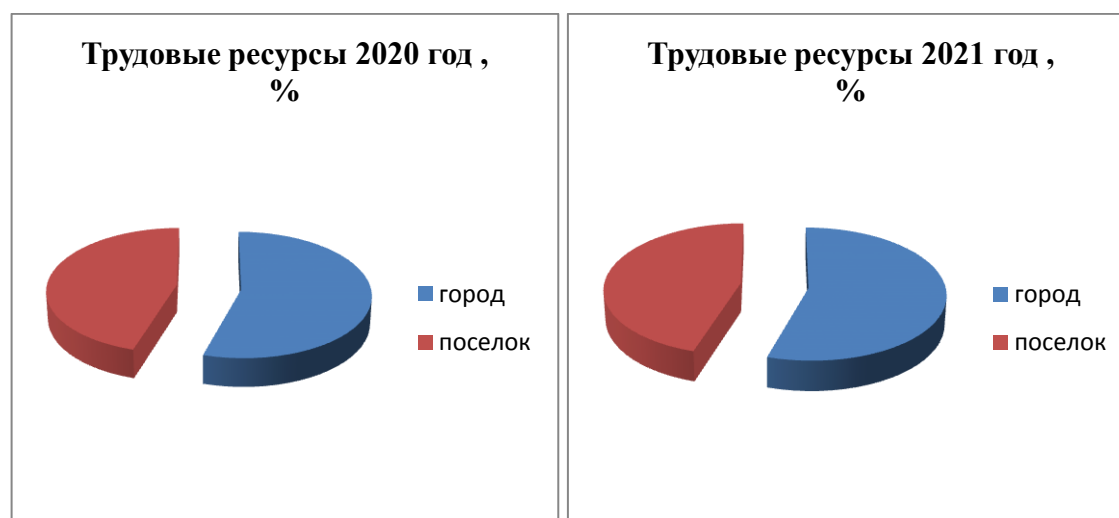
Рис. 3 - Распределение трудовых ресурсов на городское и сельское население ( в % к общему количеству трудовых ресурсов)

Согласно информации, по сравнению с аналогичным периодом 2021 года показатель увеличился на 0,8%. В статистическом ведомстве также рассказали, в какой области больше всего трудовых ресурсов: Каракалпакстан – 1 073,2 тысяч человек; Андижанская – 1 775,1 тысяч человек; Бухарская – 1072,3 тысяч человек; Джизакская — 788,9 тысяч человек; Кашкадарьинская — 1 815,8 тысяч человек; Навоийская — 569,3 тысяч человек; Наманганская – 1 590,0 тысяч человек; Самаркандская – 2 155,7 тысяч человек; Сурхандарьинская – 1 465,8 тысяч человек; Сырдарьинская – 486,0 тысяч человек; Ташкентская – 1 615,0 тысяч человек; Фергана — 2 092,3 тысяч человек; Хорезм – 1 047,6 тысяч человек и город Ташкент – 1 906,3 тысяч человек.