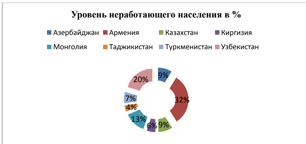
Рис. 5 - Сравнение уровня безработицы в Узбекистане и других странах СНГ в 2021-2022 году

Безработные — это лица, официально зарегистрированные в качестве безработных в соответствии с законодательством, а также временно незанятые лица трудоспособного возраста, не имеющие оплачиваемой работы или занятия, приносящего доход, самостоятельно ищущие работу и готовые приступить к ней, как только эта работа им будет предложена.